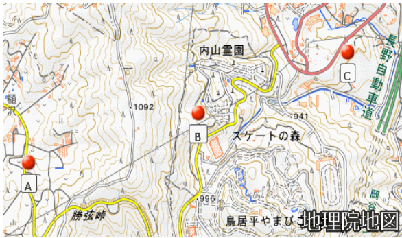
図1. 御岳第一テフラの露頭調査地点. A: 勝弦峠の北西 380 m, B: 内山霊園の最上部, C: 大川地すべり小丘. 背景地図は国土地理院の電子国土 Web システム提供.

長野県岡谷市の大川上流部, 岡谷工業高校グラウンドがある小丘は, 西側の山地からの地すべり地形と考えられる(図1および2, 井口, 2013, 2015)。付近には, 御岳第一テフラ(On-Pm1)が見られ(井口, 2019a, b), 本研究では, その高度分布から, 大川地すべりの特徴と発生年代を考察した。